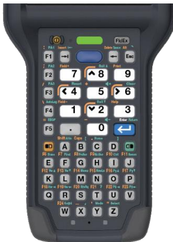
Alphanumerisch (51 Tasten)